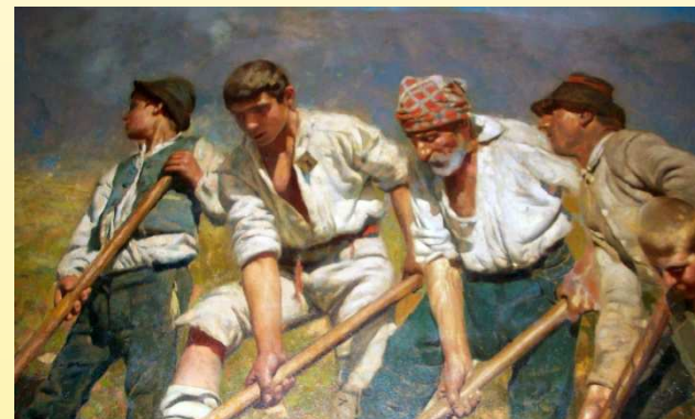
Orvieto 2018 - Muraglia

(LA MATURAZIONE DEL CONTENUTO DELL'INSEGNAMENTO)